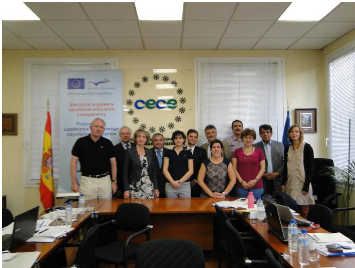
Uczestnicy spotkania Komitetu Sterującego i Komitetu Monitorującego Projektu ELEVET w Madrycie, wrzesień 2012r.