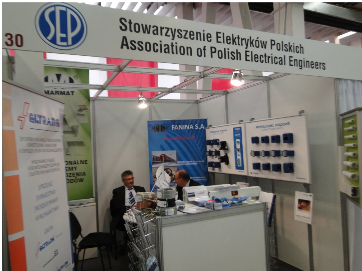
Stoisko SEP na Targach ELO SYS w 2014 r.