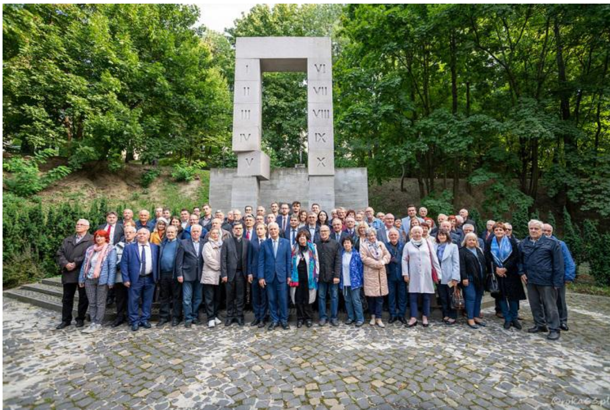
Uczestnicy uroczystości 100-lecia SEP we Lwowie, przed pomnikiem pomordowanych Profesorów Lwowskich na Wzgórzach Wuleckich.

Zostały podpisane ramowe umowy o współpracy pomiędzy SEP i Instytutem Elektrodynamiki NAN Ukrainy oraz SEP i Związkiem Naukowo-Technicznym Energetyków i Elektrotechników Ukrainy.